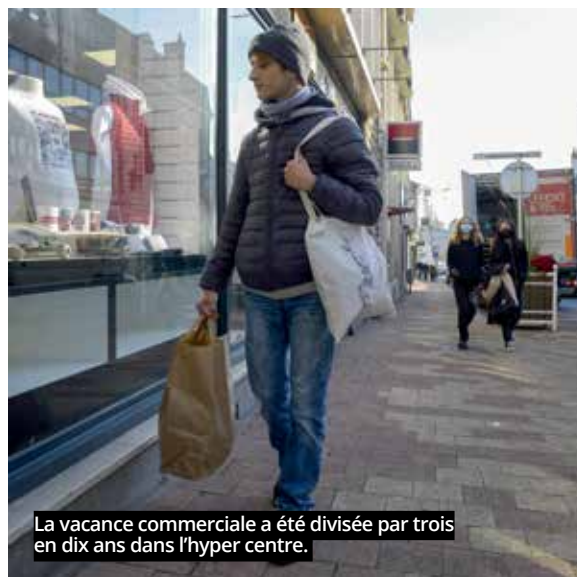
La vacance commerciale a été divisée par trois en dix ans dans l'hyper centre.