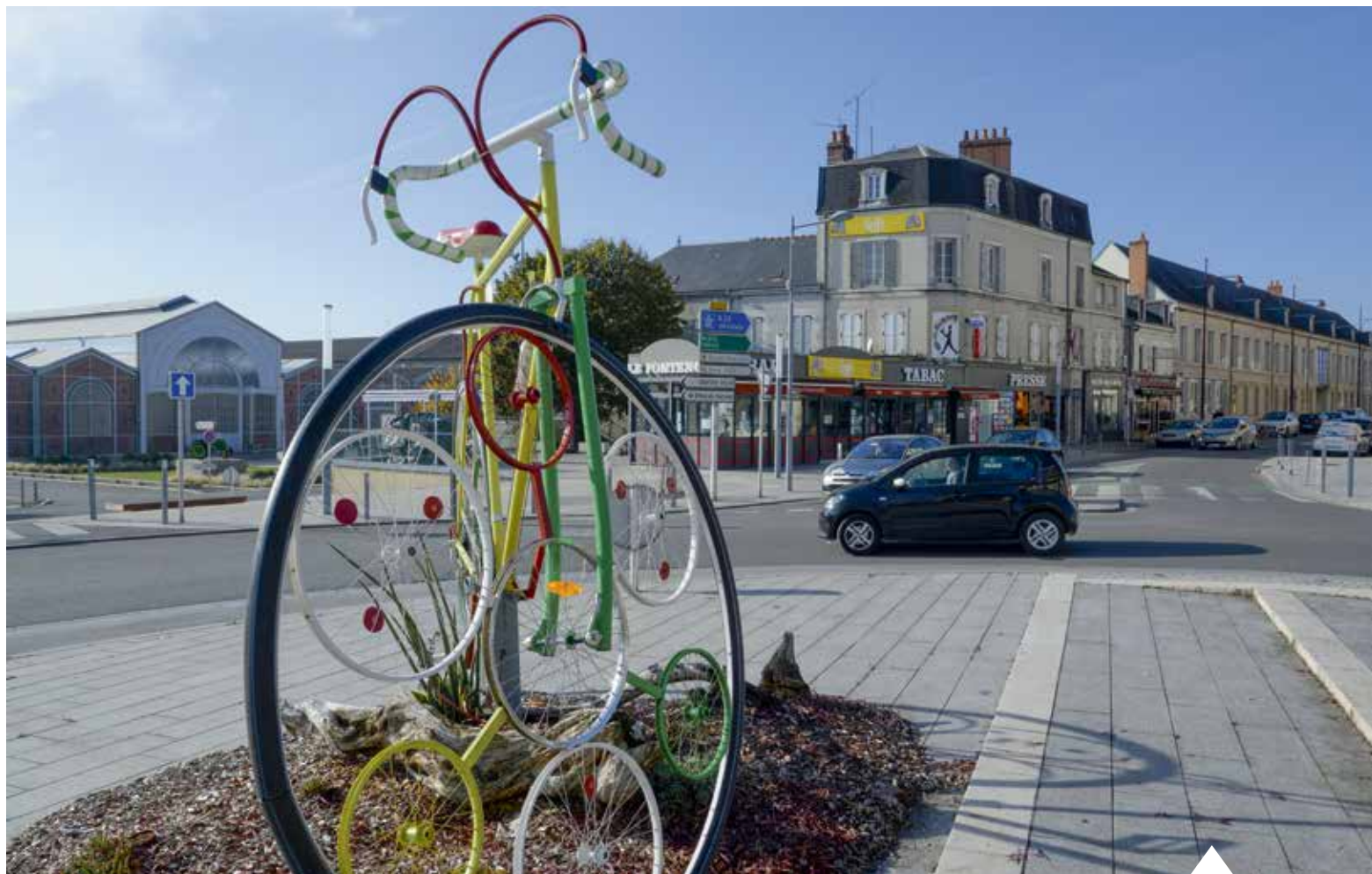
Commerces, logements, espaces publics... un nouveau souffle sur le centre-ville de Vierzon.