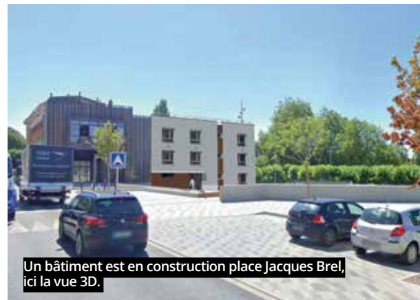
Un bâtiment est en construction place Jacques Brel, ici la vue 3D.

C olonne vertébrale du centre-ville, l'avenue de la République, délimitée par le rond-point Gabriel-Péri et la nouvelle place Jacques-Brel, apparaît comme l'un des symboles du renouveau vierzonnais. Si quelques rideaux de fer restent baissés, de nombreuses vitrines ont retrouvé des couleurs. Les chiffres confirment d'ailleurs l'impression ressentie : dans l'hyper centre (hors commerces dans les différents quartiers), en dix ans, la vacance commerciale a été divisée par trois, passant de 33 à 11%, voire même 7% avenue de la République.